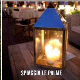
SPIAGGIA LE PALME