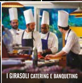
I GIRASOLI CATERING E BANQUETING