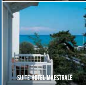
SUITE HOTEL MAESTRALE