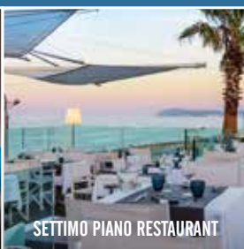
SETTIMO PIANO RESTAURANT