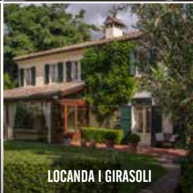
LOCANDA I GIRASOLI